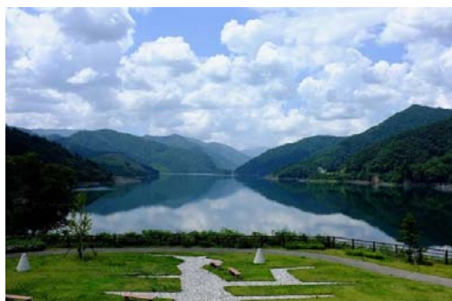
徳山会館からの景色

※徳山ダムHP : http://www.water.go.jp/chubu/tokuyama/