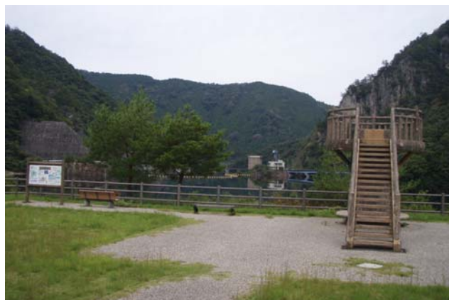
大島ダムの左岸広場

※大島ダムのご案内 水資源機構豊川用水総合事業部： http://www.water.go.jp/chubu/toyokawa/ ※百間滝観光についての問い合わせ先 新城市観光協会： http://shinshirokankou.com/