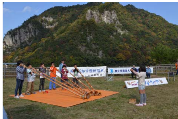
ウォーキング大会での催し物の様子