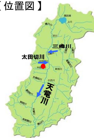
天竜川上流域図(長野県)