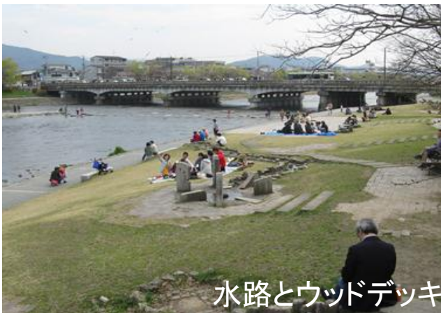
水路とウッドデッキ