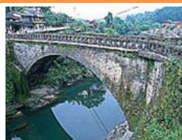
ホテルと石橋の里、八女市上陽町