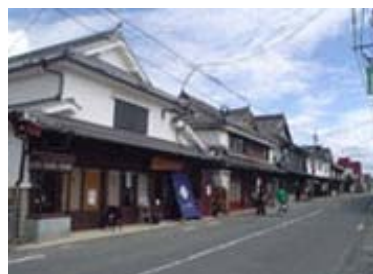
八女福島の伝統的な町屋建築

星野川は、福岡県八女市星野東部の熊渡山に源を発し、星野地区内を東から西に流れる、県内で最も美しい川として知られています。