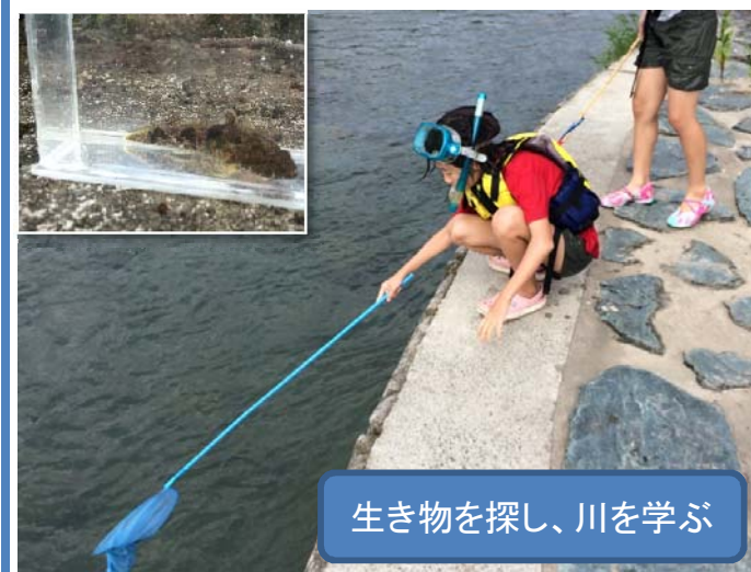
生き物を探し、川を学ぶ