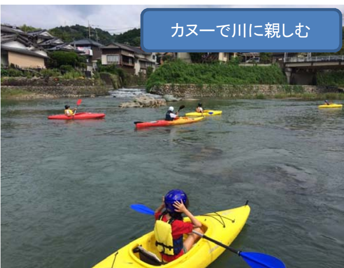
カヌーで川に親しむ