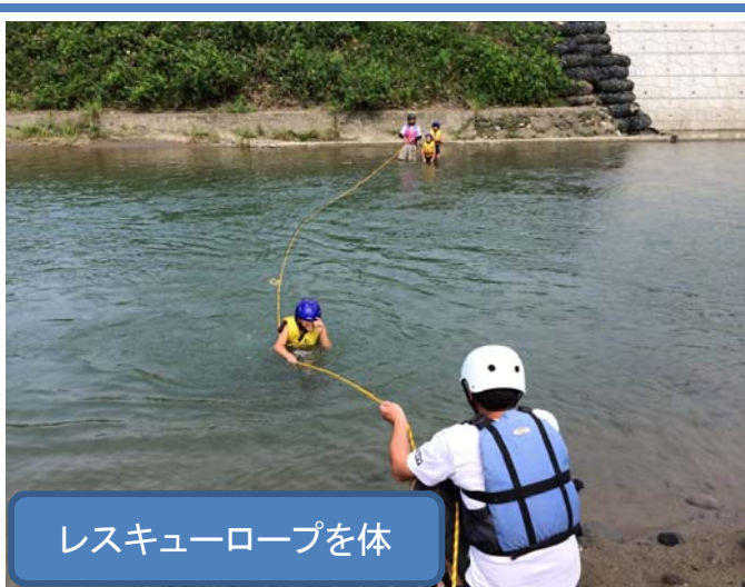
レスキューロープを体