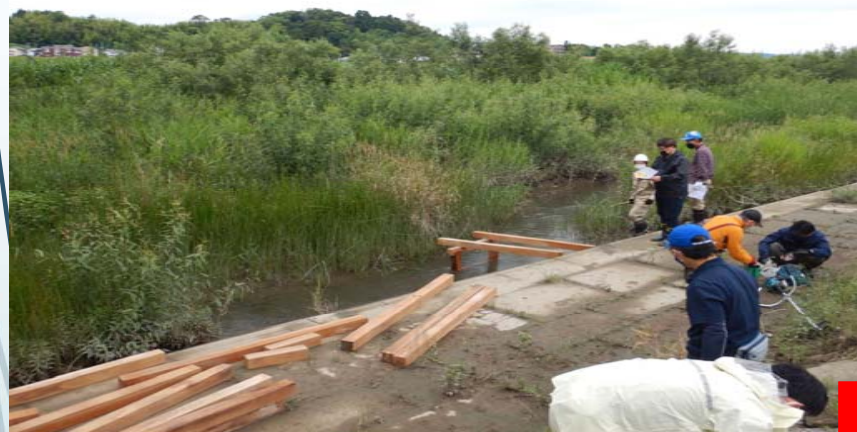
小川を渡るための仮橋を設営