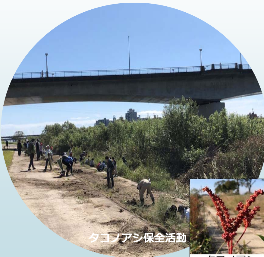
タコノアシ保全活動