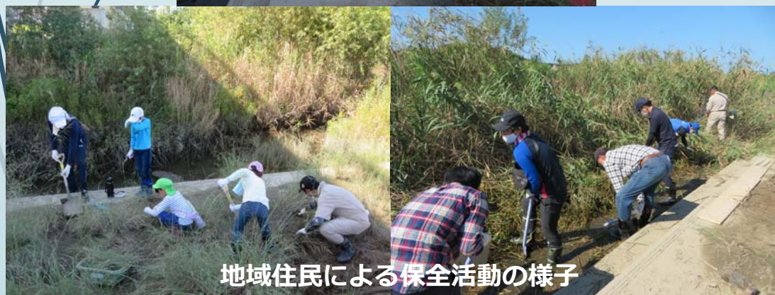
地域住民による保全活動の様子