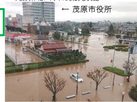
令和元年10月台風21号に伴う豪雨（一宮川と豊田川合流点付近）