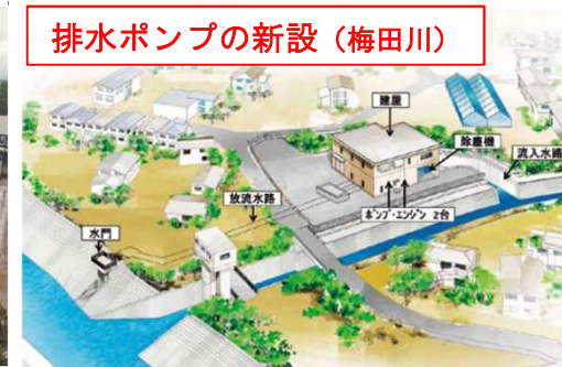
排水ポンプの新設（梅田川）