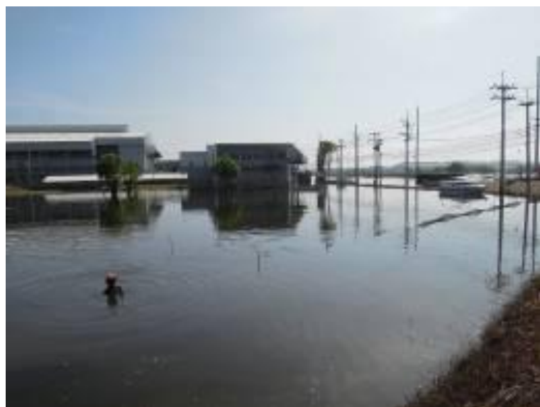
排水前の状況（11月19日）