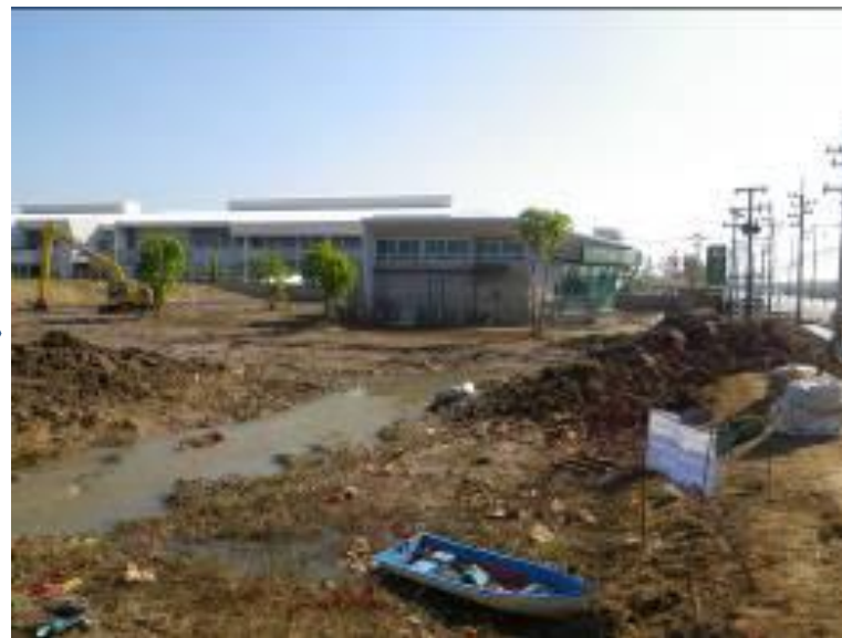
ロジャナ工業団地