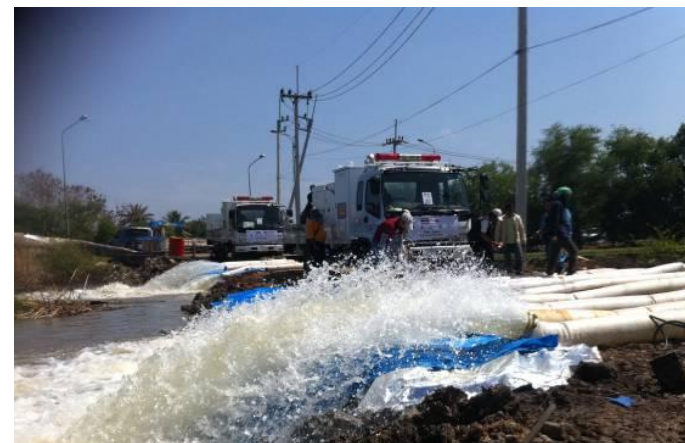
排水ポンプ車稼働状況（11月19日作業開始）