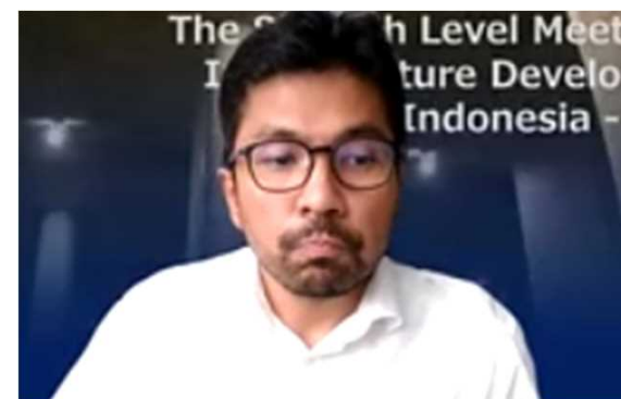
インドネシア側の発表の状況