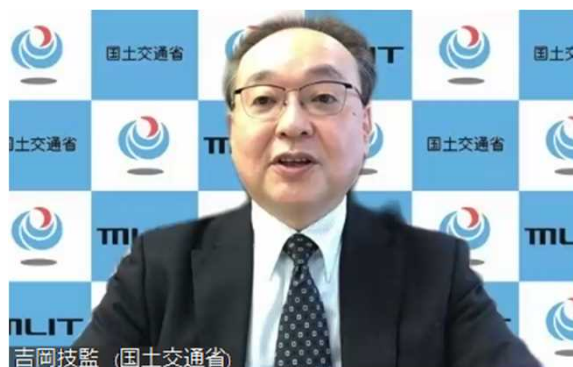
全体会合での吉岡技監ご挨拶

3.参加者 【日本】国土交通省(吉岡技監、横田海外プロジェクト審議官、総合政策局海外プロジェクト推進課、国際政策課、水管理・国土保全局河川計画課国際室、下水道部下水道企画課下水道国際・技術室他)、JICA専門家、(一社)国際建設技術協会 他 【インドネシア】公共事業・国民住宅省(モハマド事務次官他) 他