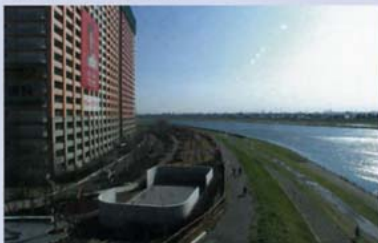
高規格堤防上に建設中の民間マンション 江戸川 千葉県市川市