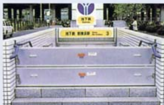
浸水防止施設の整備イメージ(止水板)

民間業者が地下駅、地下街、地下駐車場等の出入口に浸水を防止するための防水扉、防水板等を設置する場合