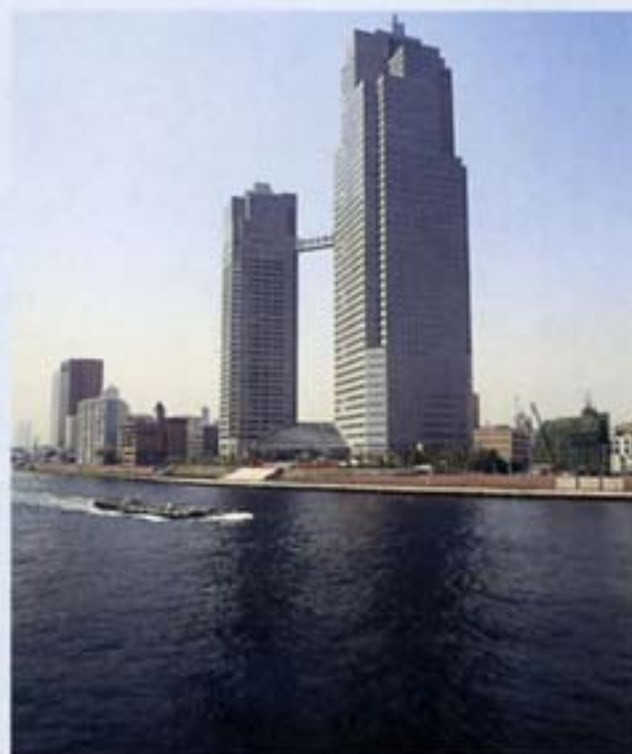
聖路加国際病院再開発 隅田川 東京都

市街地における治水事業（高規格堤防整備事業、マイタウン・マイリバー整備事業等）と一体的に整備され、市街地における良好な水辺空間を創出する建築物整備を行う場合