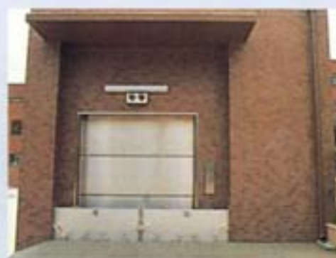
浸水防止施設の整備イメージ