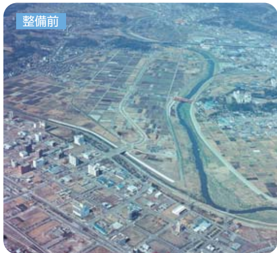
鶴見川多目的遊水地（神奈川県横浜市）