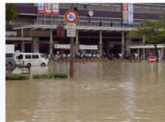
平成15年 福岡市内浸水状況