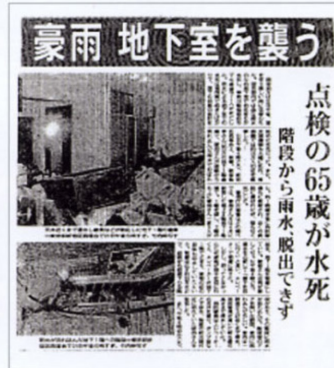
毎日新聞 平成11年7月22日（東京本紙／朝刊）