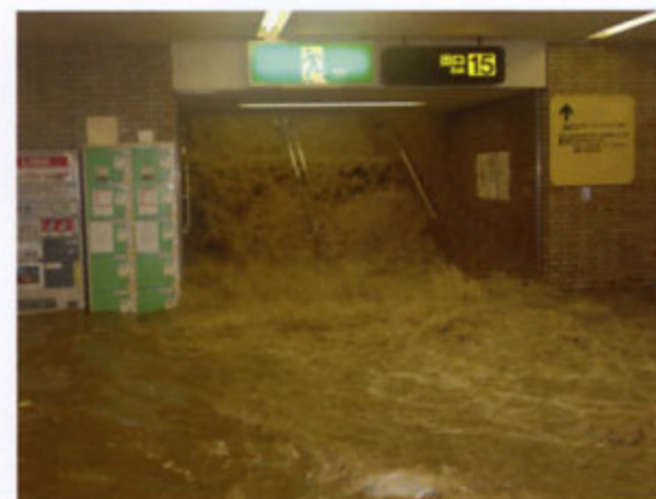
平成15年 福岡市の地下街浸水状況