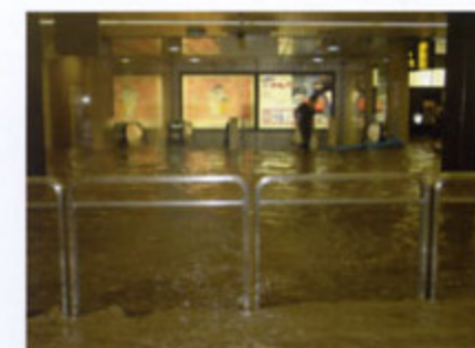
平成15年 福岡市の地下街浸水状況