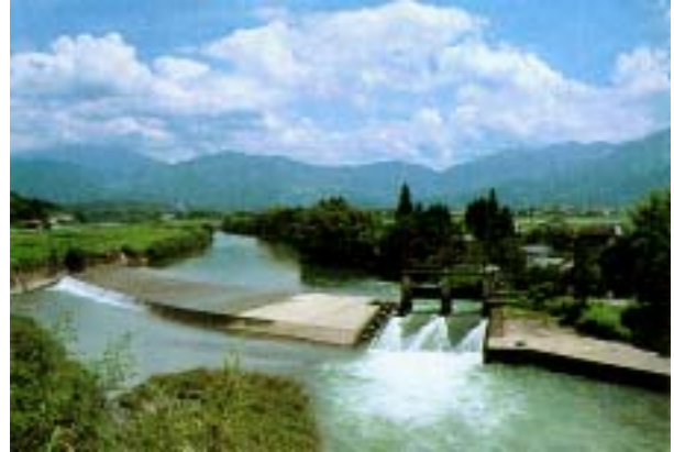
百太郎堰（改修されている）