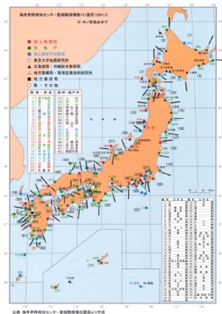
図 3.9 潮位観測施設の位置図

(国土交通省、国土地理院、気象庁、海上保安庁等が日本各地に潮位観測施設を設置している。)