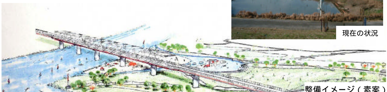
整備イメージ（素案）