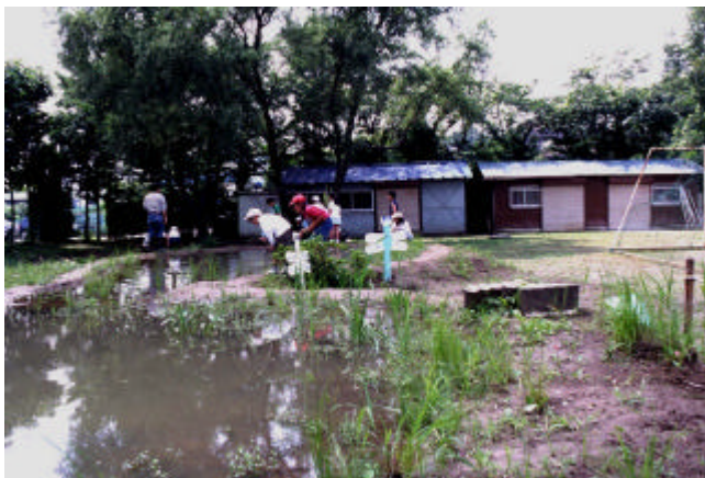
環境学習の場として校内に整備されているビオトープと活用状況（古河第五小学校）