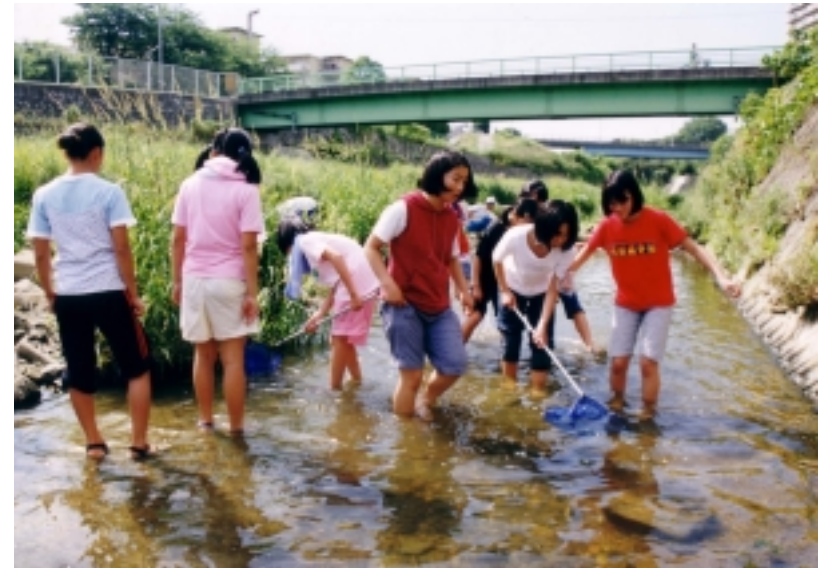
「子どもの水辺」での活動の様子 （近木川（大阪府））

「子どもの水辺」において、安全に楽しく活動するために水辺の整備が必要な場合には、「水辺の楽校プロジェクト」により整備を実施。