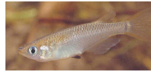
リバーフォレスト整備センター（1996）より

産卵：5月～7月に小河川、池沼、水田、水田または用水路の岸近くの水面に浮いている藻や水草に産卵。仔稚魚は水田側溝や用水路泥底などで成長。