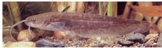
リバーフォレスト整備センター（1996）より