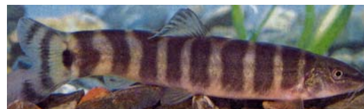
岡山市教育委員会（1986）より