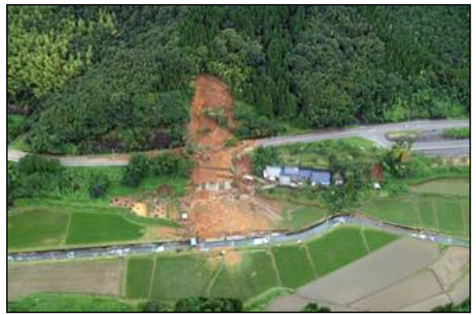
鹿児島県 さつま町内