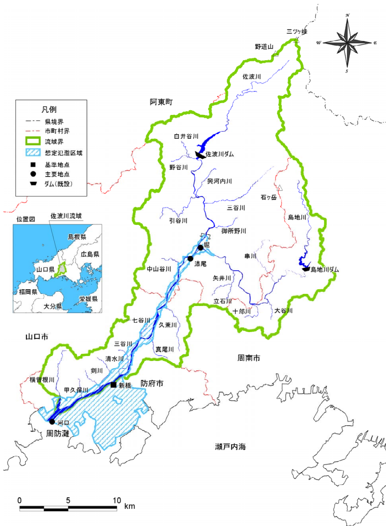
(参考図) 佐波川 水系図