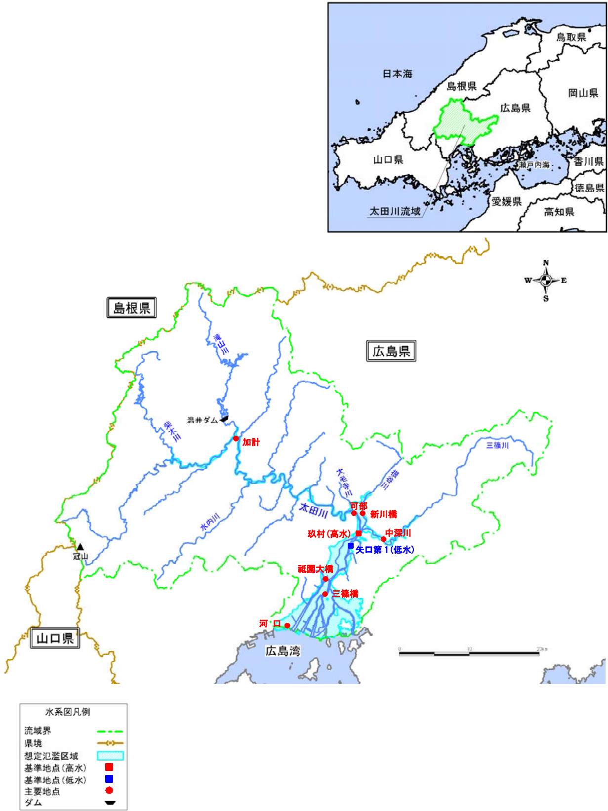
(参考図) 太田川水系図