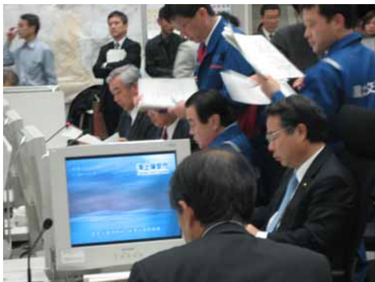
国土交通省防災センターでの指揮 (冬柴国土交通大臣)