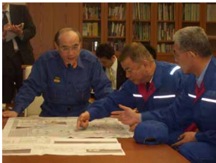
石川県庁での会談 (吉田国土交通政務官)