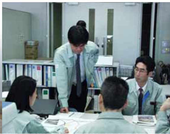
災害復旧支援のため担当係長を石川県に派遣 (砂防部保全課)