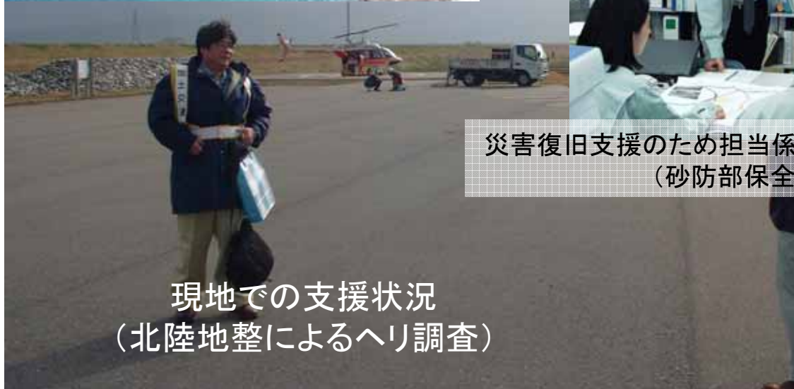
現地での支援状況 (北陸地整によるヘリ調査)