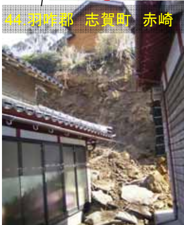
災害関連緊急砂防等事業(事業採択箇所)