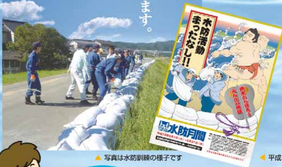
▲写真は水防訓練の様子です