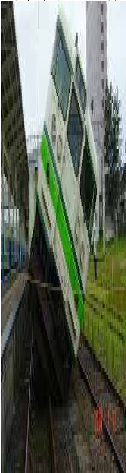
相崎駅の列車脱線