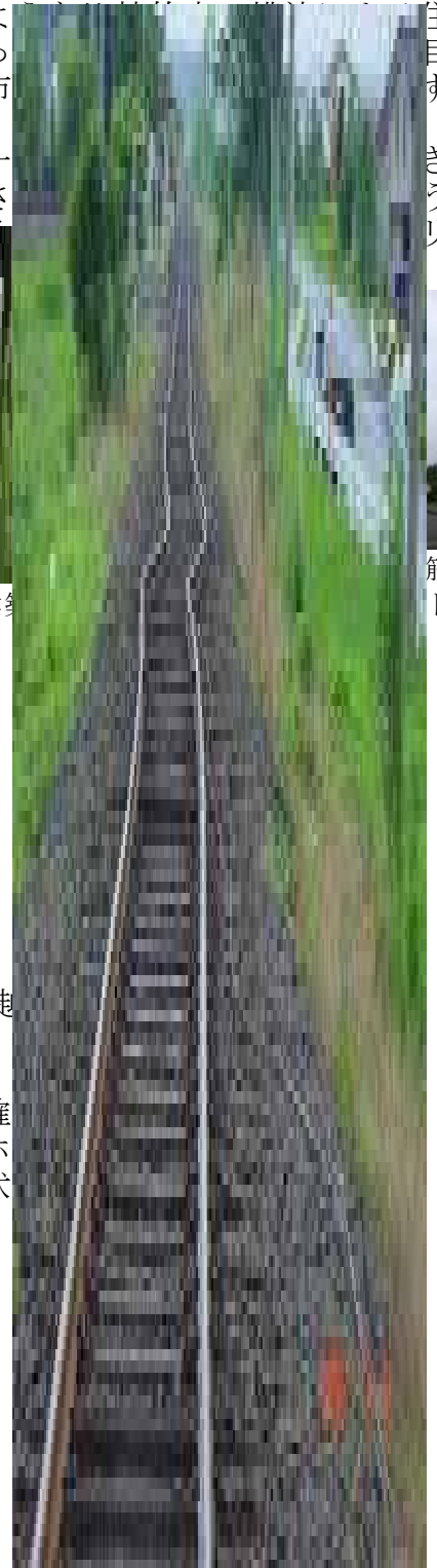
荒浜駅付近のレールの変状