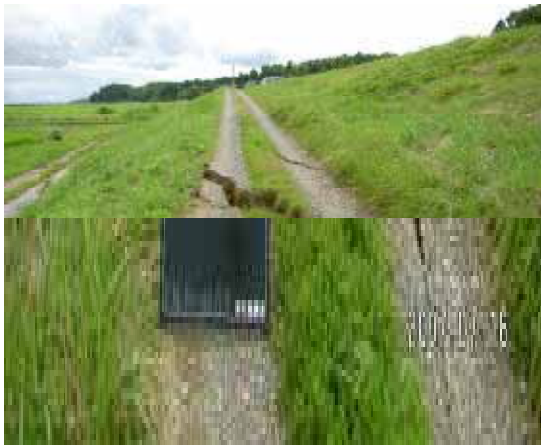
堤防川裏小段のクラック 信濃川本川左岸（長岡市町軽井）