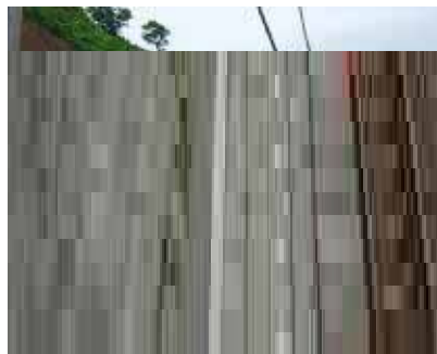
青海川駅付近の土砂流入

脱線状況、レールの変状等を確認 からの土砂の流入状況、海側ホ ホームの変状、レールの変状