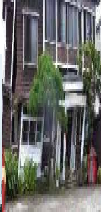
大田交差点付近の建設現場