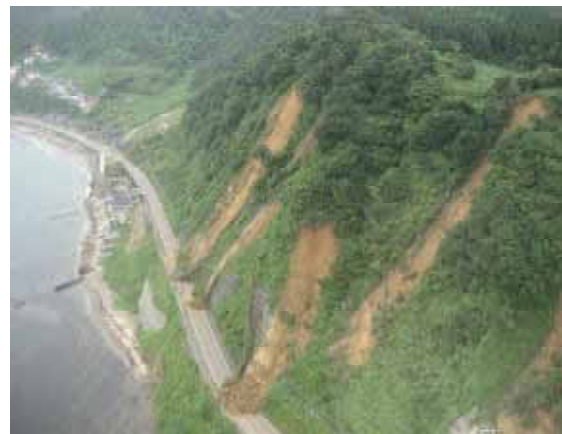
国道352号柏崎市坂之下