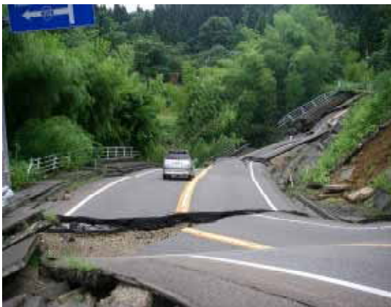
国道8号長岡市大積千本町