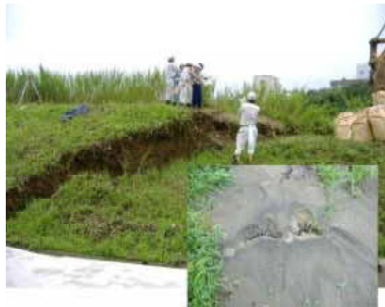
堤防の沈下と液状化による噴砂跡 鯖石川左岸（柏崎市橋場町）