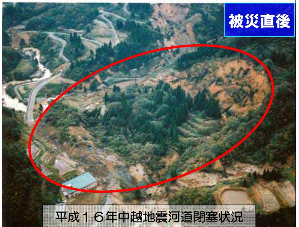
平成16年中越地震河道閉塞状況