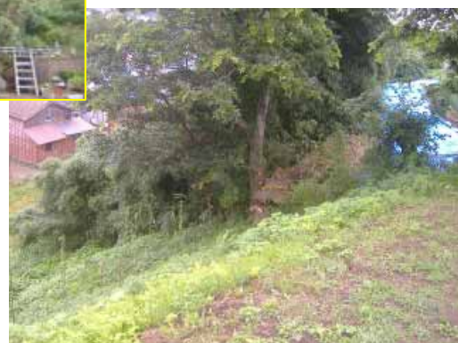
かしわぎし くじらなみ 新潟県 柏崎市 鯨波3丁目