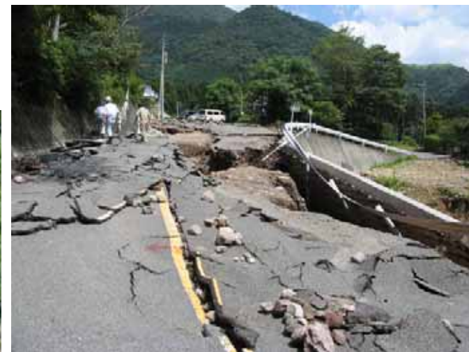
①ブロック積み及び路面の被災