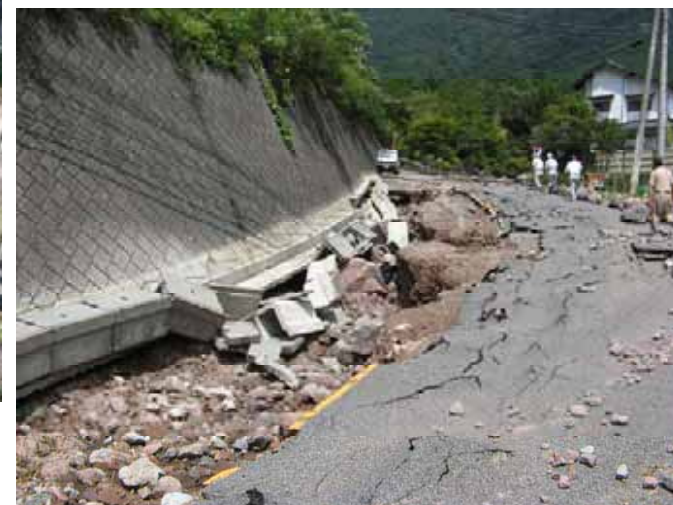
②路面及び側溝の被災