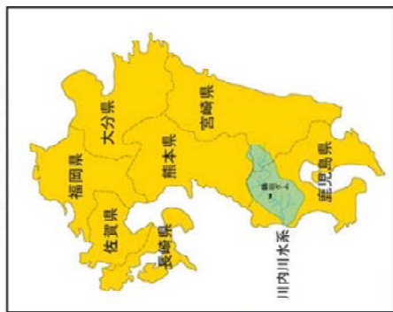
川内川水系位置図