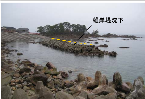
③両津海岸大川地区海岸(佐渡市大川地先)