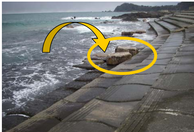
④両津海岸羽二生地区海岸(佐渡市羽二生地先)