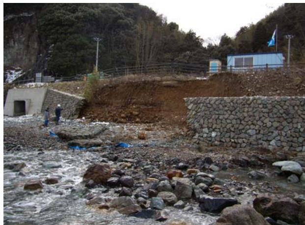
②主要地方道佐渡一周線(佐渡市水津地先)