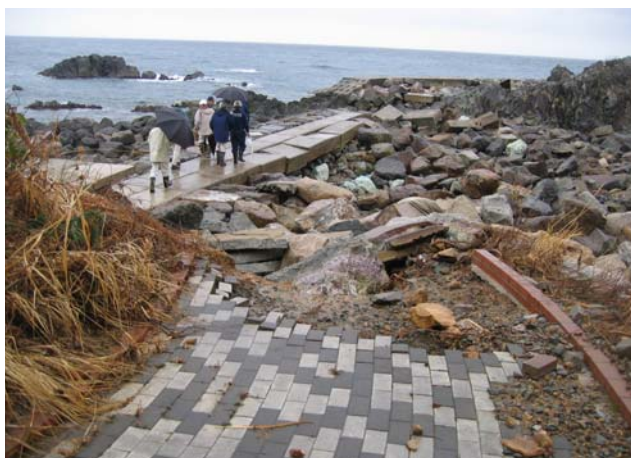
①両津海岸水津地区海岸(佐渡市水津地先)