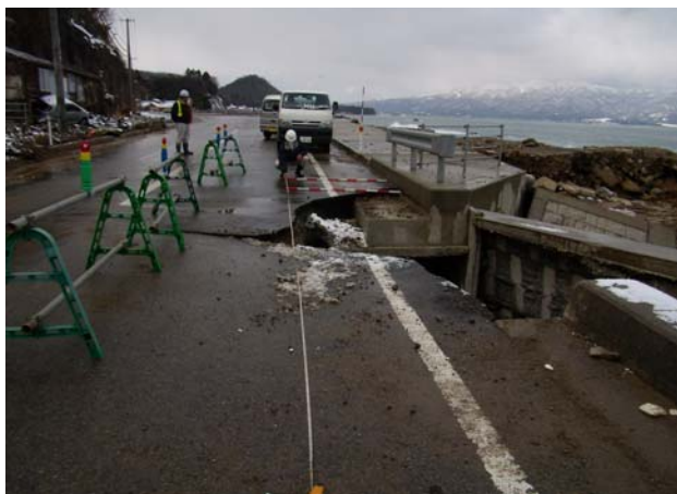
⑤主要地方道佐渡一周線(佐渡市羽二生地先)