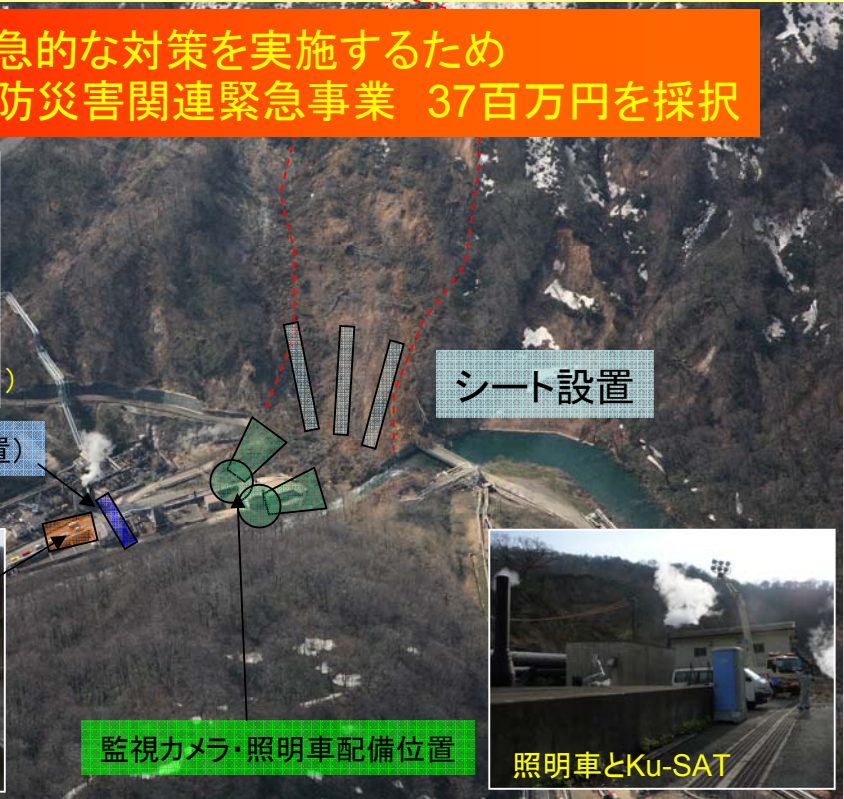
監視カメラ・照明車配備位置