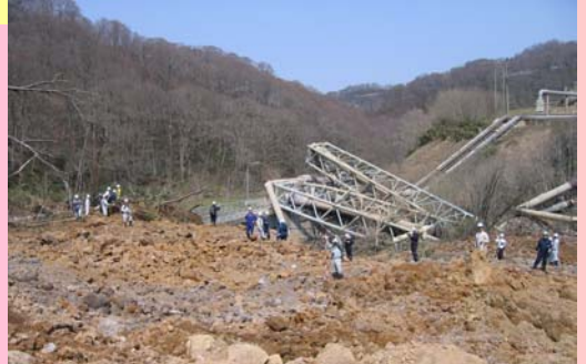
土木研究所・本省による現地調査(22日)