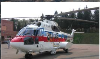
ヘリによる調査(21、22日)