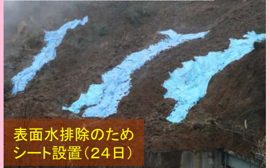
表面水排除のためシート設置(24日)