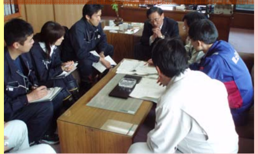
災害対応について雫石町長と協議(22日)