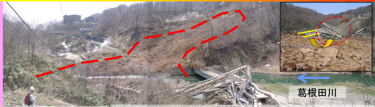
土砂の押出しにより歪曲した地熱発電施設の配管