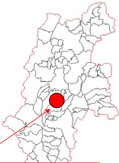
長野県岡谷市 湊3丁目