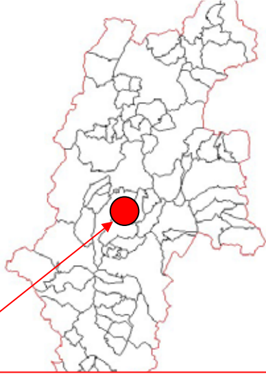
長野県上伊那郡 辰野町 飯沼