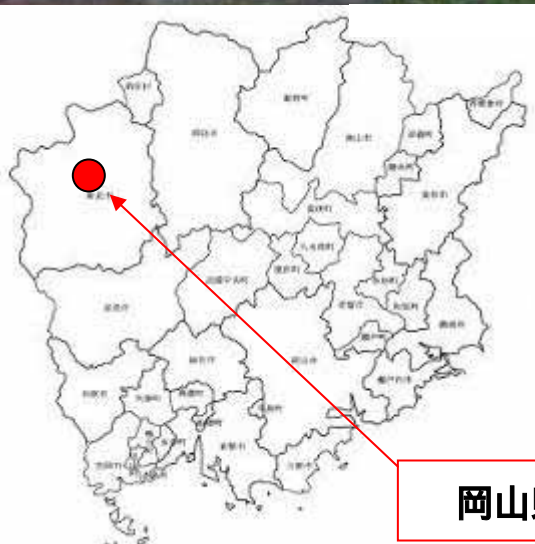
岡山県 新見市 坂本