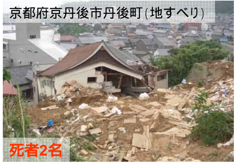
京都府京丹後市丹後町 (地すべり)