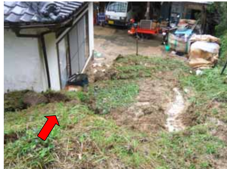
こゆぐんきじょうちょう 8/18 宮崎県児湯郡木城町(住家被害1棟)【がけ崩れ】