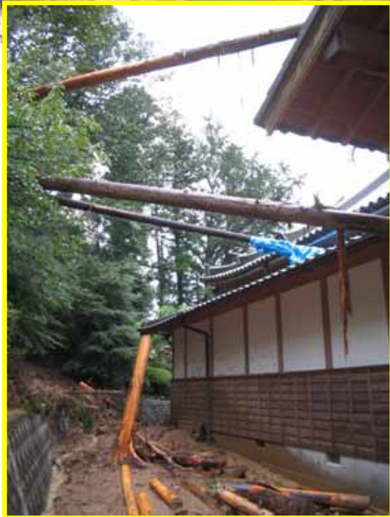
さえきしやよい 8/18 大分県佐伯市弥生(住家被害1棟)【がけ崩れ】