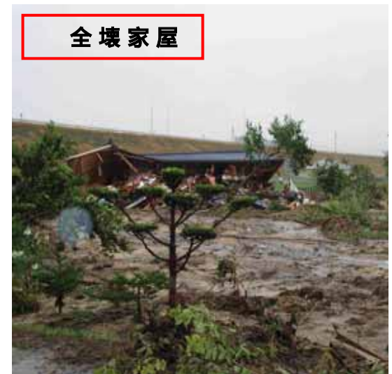
さるくん ひらが 8/18北海道沙流郡日高町平賀 (住宅被害1棟)【がけ崩れ】