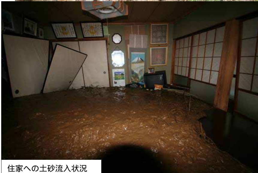
住家への土砂流入状況