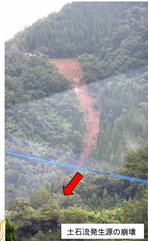
土石流発生源の崩壊