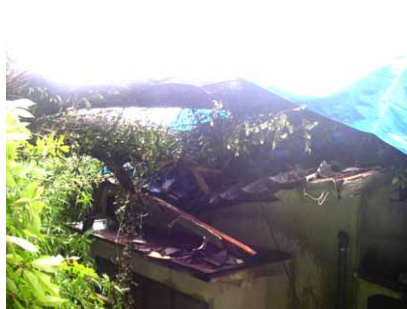
うさしあじむまち 8/18 大分県宇佐市安心院町(住家被害1棟)【がけ崩れ】