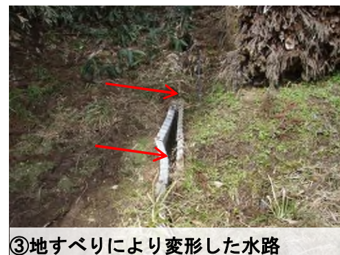
③地すべりにより変形した水路 (3月17日)