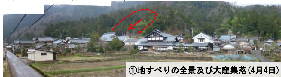
①地すべりの全景及び大窪集落 (4月4日)