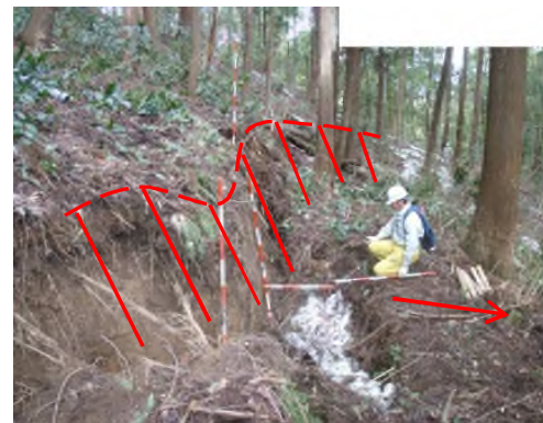
②地すべりにより発生した1.5mの滑落 (3月17日)