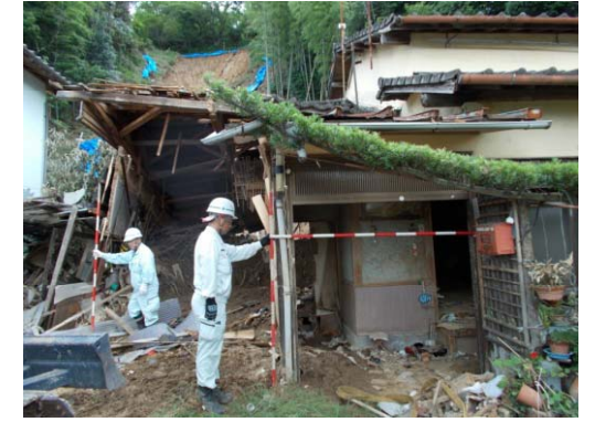
③ 被害状況 (死者1名、人家半壊1戸)