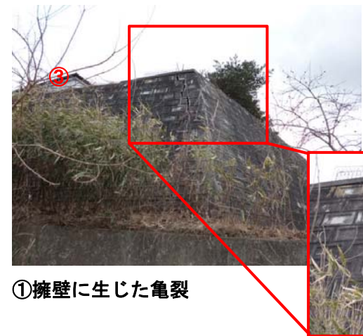
①擁壁に生じた亀裂