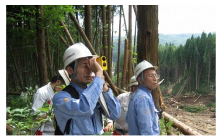
国総研 砂防研究室の専門家による現地調査を実施 (8月10日)