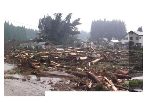
【専門家による現地調査】