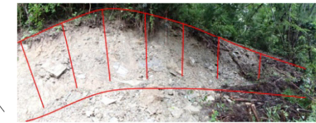
地すべりブロック頭部滑落崖

【西久保地区】 ながおかくんおおとよちょう 長岡郡大豊町 発生日時 : 平成26年8月3日 保全対象 : 人家 2戸・町道 崩壊の規模 : 幅100m 長さ130m 主な対策工 : アンカー工 N=72本