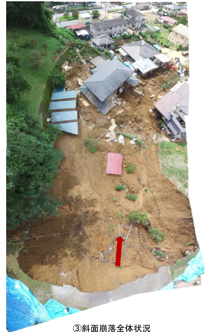
③斜面崩落全体状況