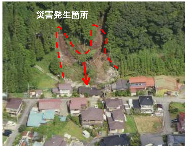
②斜面崩落全体状況