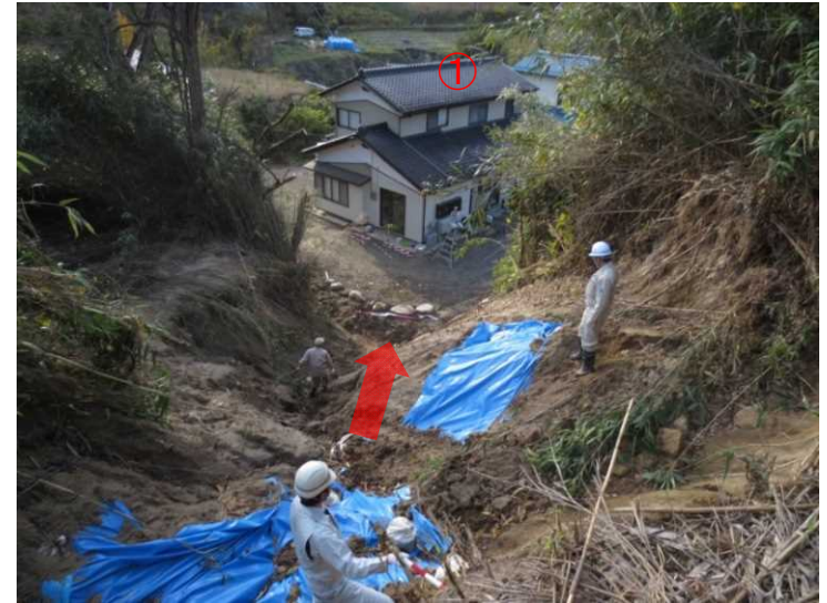
①斜面崩落全体状況

だてし やながわまち やまふにゆう 福島県伊達市梁川町大字山舟生 発生日時：平成27年9月9日 保全対象：人家2戸 崩壊の規模：幅19m 高さ11m 被害状況：家屋一部損壊1戸 主な対策工：掘削工、法面工、水路工