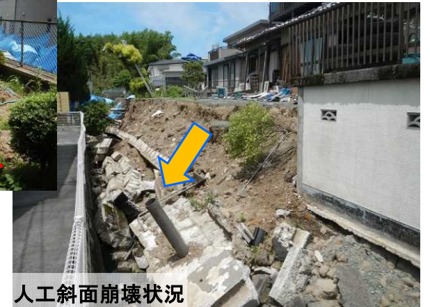
人工斜面崩壊状況