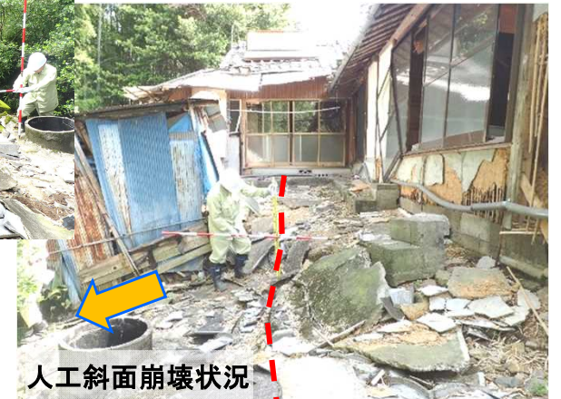
人工斜面崩壊状況