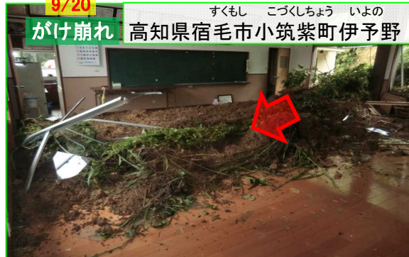
9/20 がけ崩れ すくもし こづくしちよう いよの 高知県宿毛市小筑紫町伊予野