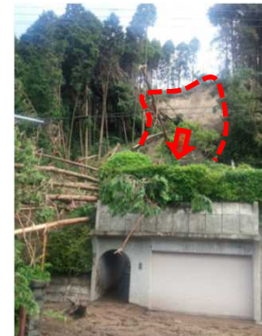
9/20 がけ崩れ そおし おおすみまち なかのうち 鹿児島県曾於市大隅町中之内