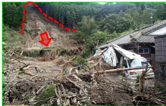
9/20 がけ崩れ すくもし こづくしちよう いよの 高知県宿毛市小筑紫町伊予野