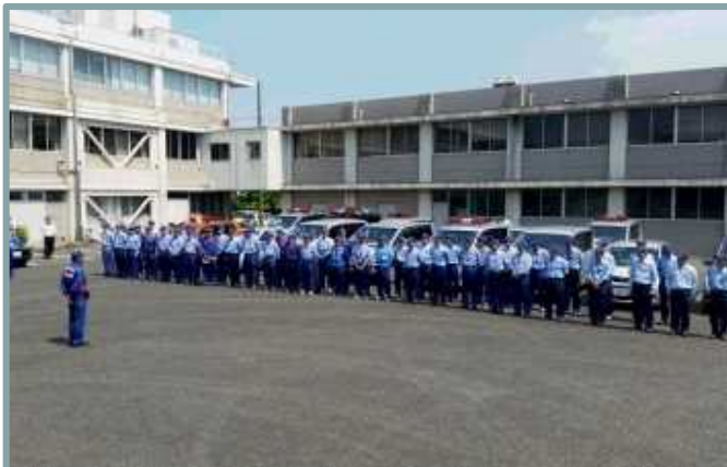
現地調査への出発式