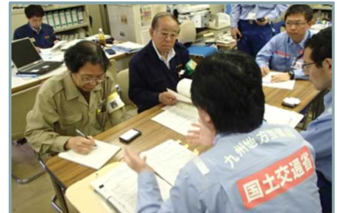
市町村長等への報告