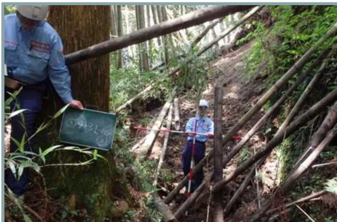
土石流危険溪流の点検