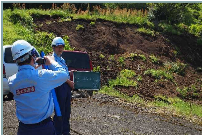
急傾斜地崩壊危険箇所の点検