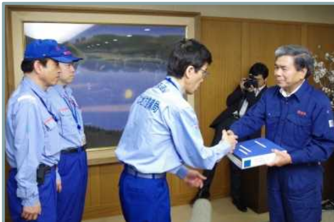
熊本県知事への報告