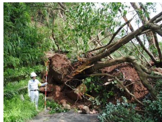
市道(不老山公園線)の被災状況