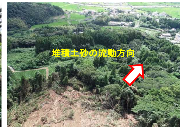
末端部の土砂堆積状況