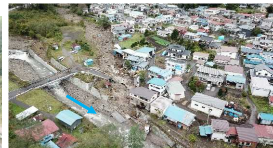
嬭恋村田代地区の被災状況(吾妻川)