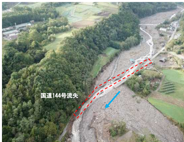
嬭恋村大笹地区の被災状況(吾妻川)