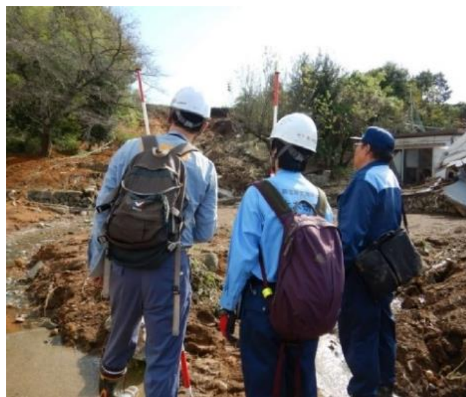
TEC-FORCEによる被災状況調査