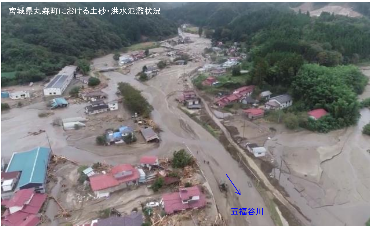
宮城県丸森町における土砂・洪水氾濫状況