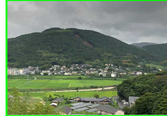
8/27 まつうら しさちょう たかのめん 地すべり 長崎県松浦市志佐町高野免