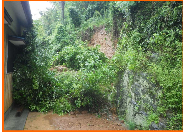
発生日確認中 がけ崩れ たけお たちばなちょう ながしま 佐賀県武雄市橋町大字永島