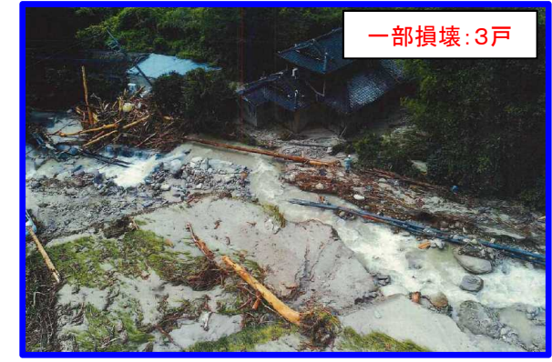
さが きんりゆうまち 佐賀県佐賀市金立町