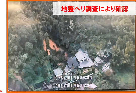
たけお たちばなちよう ながしま 佐賀県武雄市橋町大字永島