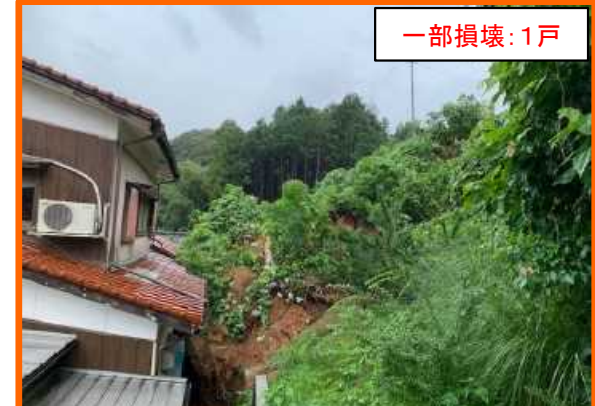
うべ おの 山口県宇部市大字小野