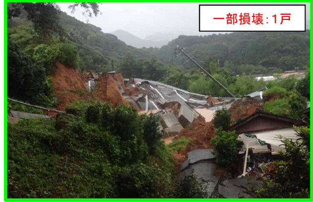
まつうら いまふくちよう きためん 長崎県松浦市今福町北免