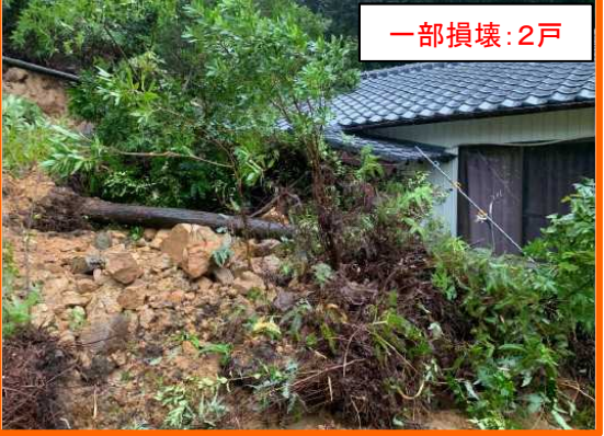
させぼ しかまちちよう しもうたがうら 長崎県佐世保市鹿町町下歌ヶ浦