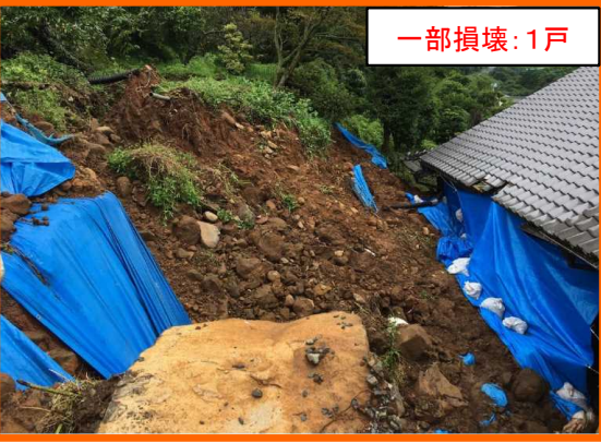
させぼ ゆのきちよう 長崎県佐世保市柚木町