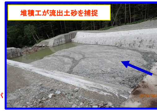
まつもと あづみ 長野県松本市安曇