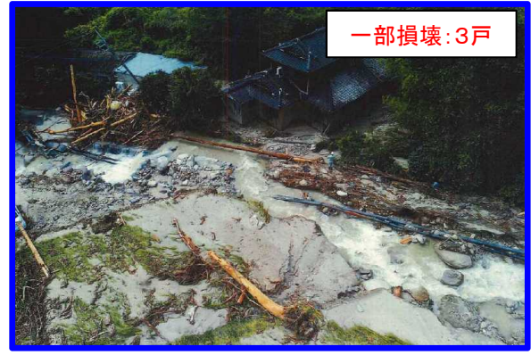
さが きんりゆうまち 佐賀県佐賀市金立町