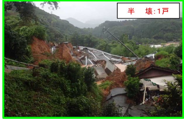
まつらら いまふくちよう きためん 長崎県松浦市今福町北免