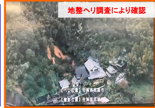
たけお たちばなちよう ながしま 佐賀県武雄市橋町大字永島