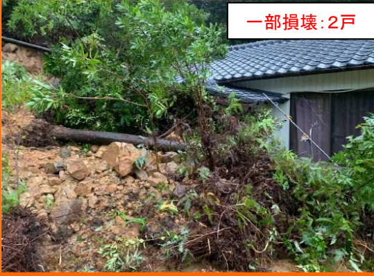
させぼ しかまちちよう しもうたがうら 長崎県佐世保市鹿町町下歌ヶ浦