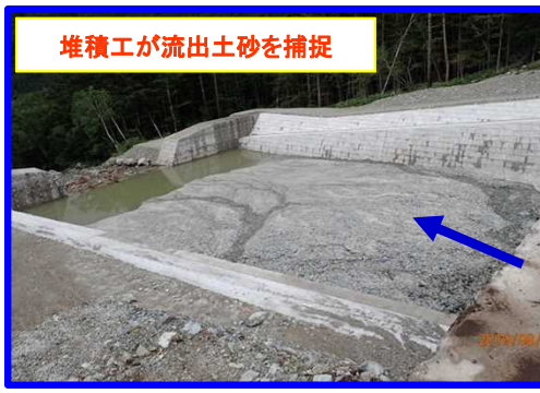
まつもと あづみかみこうち 長野県松本市安曇上高地