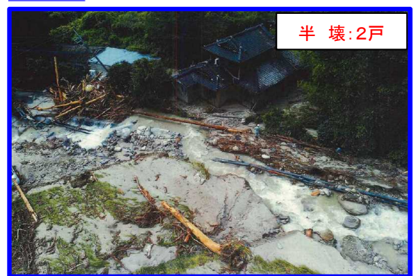
さが きんりゆうまち 佐賀県佐賀市金立町