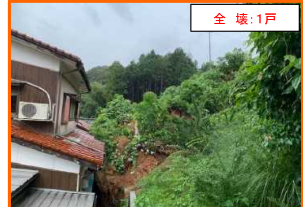
うべ おの 山口県宇部市大字小野