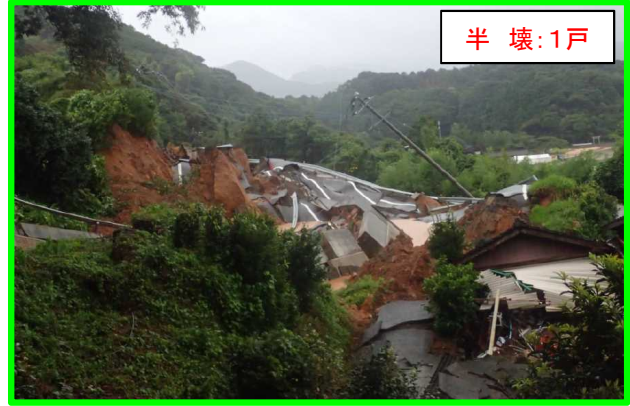
まつうら いまふくちよう きためん 長崎県松浦市今福町北免