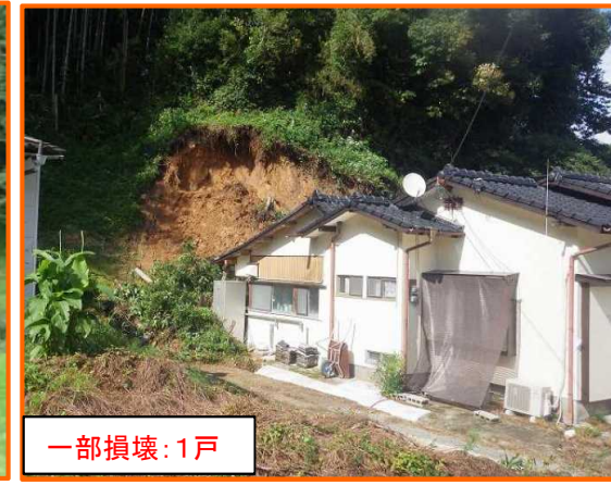
7/22 熊本県玉名郡南関町久重 たまなぐん なんかんまちくしげ がけ崩れ