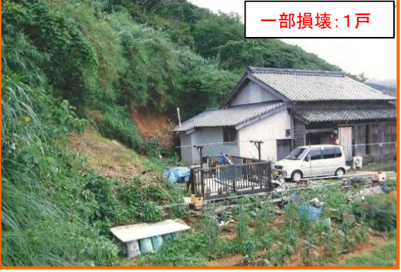
7/20 長崎県五島市玉之浦町中須 ごとう たまのうらまち なかす がけ崩れ