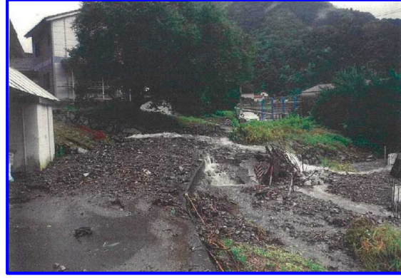
7/20 香川県高松市国分寺町大字福家 たかまつ こくぶんじちやう ふけ がけ崩れ