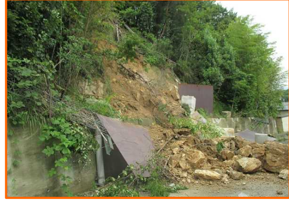
7/20 香川県高松市国分寺町大字福家 たかまつ こくぶんじちやう ふけ がけ崩れ