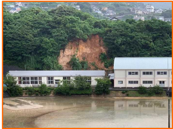
7/20 長崎県南松浦郡新上五島町丸尾郷 みなみまつらぐん しんかみごとうちょう まるおごう がけ崩れ